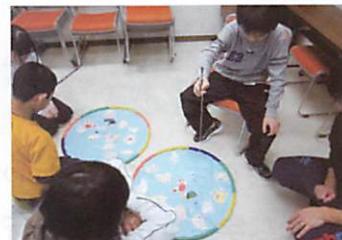
児童養護施設での学習支援

私は繰り返し学生に問います。さまざまな生きづらさを抱える子どもたちを前に、教師として君はどう生きるのかと。