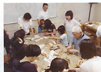
釧路市教育委員会不登校支援事業でのボランティア